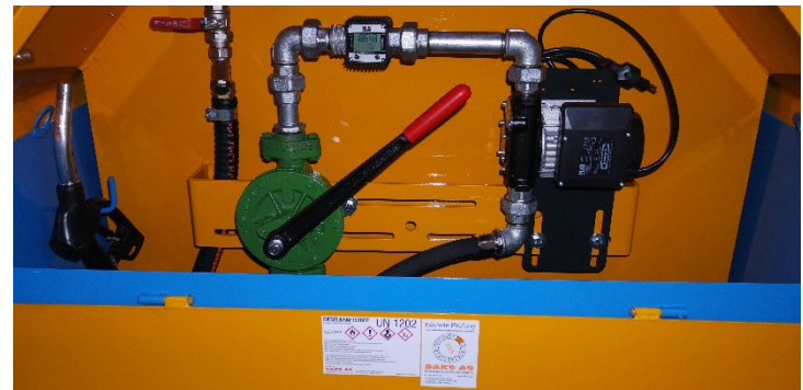
Armaturenabteil mit Handpumpe, Elektropumpe und Zähler