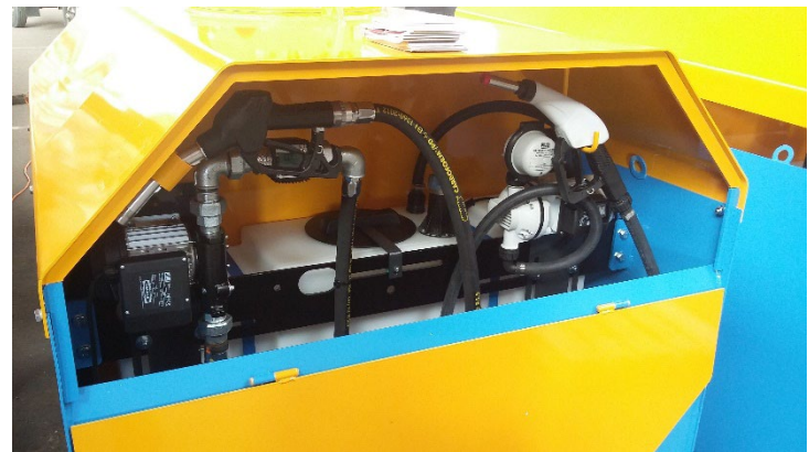
BT1750-1 / BT1000-2 mit zusätzlich 180 Liter Ad-Blue Tank und Abgabearmaturen.